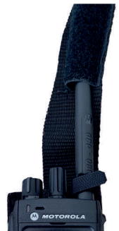
Einfache Fixierung der Antenne