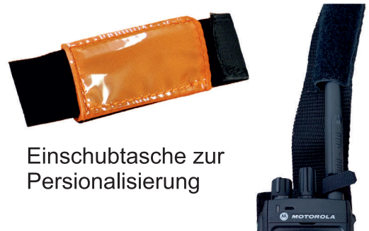
Einschubtasche zur Personalisierung

Gewicht: ca. 100 - 110 g Starkes und leichtes Material: Polyester 600, Nylon 420, Duraflex Schließen