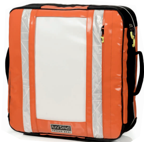
Viper 15V plus leuchtorange 779730