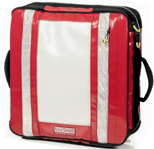
Viper 15V plus fieryred 779700