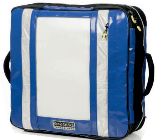
Viper 15V plus saphierblue 779720