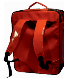
Glatter und leicht zu desinfizierender Rücken